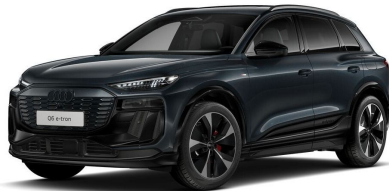
Technisch generiertes Bild. Tatsächlicher Zustand und Ausstattung können abweichen. Vergleichen Sie hierzu die Zustands- sowie Ausstattungsbeschreibung. Fahrzeug ist 8-fach bereift.