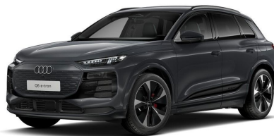
Technisch generiertes Bild. Tatsächlicher Zustand und Ausstattung können abweichen. Vergleichen Sie hierzu die Zustands- sowie Ausstattungsbeschreibung. Fahrzeug ist 6-fach bereift.