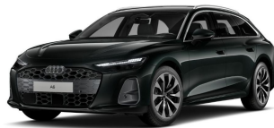
technisch generiertes Bild; Tatsächlicher Zustand und Ausstattung können abweichen, vergleichen Sie hierzu die Zustands- sowie Ausstattungsbeschreibung.