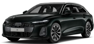
technisch generiertes Bild; Tatsächlicher Zustand und Ausstattung können abweichen, vergleichen Sie hierzu die Zustands- sowie Ausstattungsbeschreibung.