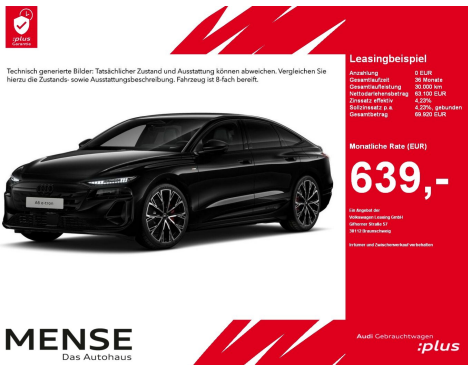
Technisch generierte Bilder. Tatsächlicher Zustand und Ausstattung können abweichen. Vergleichen Sie hierzu die Zustands- sowie Ausstattungsbeschreibung. Fahrzeug ist 8-fach bereit.