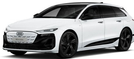
Technisch generierte Bilder: Tatsächlicher Zustand und Ausstattung können abweichen. Vergleichen Sie hierzu die Zustands- sowie Ausstattungsbeschreibung. Fahrzeug ist 8-fach bereift.